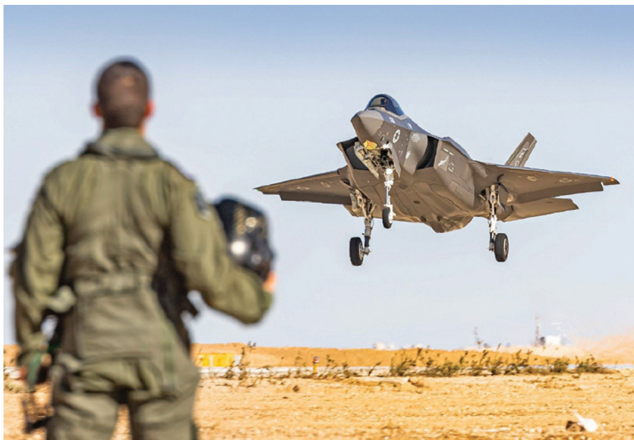
מטוס "אדיר" של חיל האוויר (אתר חיל האוויר)

האזורית לתקיפה, במיוחד של בעלות בריתה של איראן. 5 אפשר להסיק, כי בשקלול שיקולים אלה ואחרים, הצביע מאזן עלות מול תועלת מערכת נגד ביצוע התקיפה.