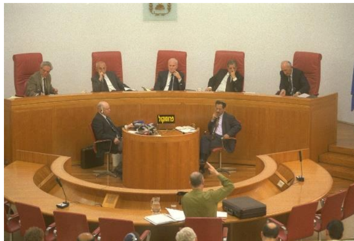
האלוף דני יתום (במיל') מעיד בפני ועדת שמגר (לע"ם)

בהתאם לכך, והגם שהעתירה בבג"ץ 5905/95 לא התקבלה, אמירות בית המשפט בדיון בתיק זה ובתיקים אחרים מסוגו, הנוגעים לאיזון בין זכויות התושבים לבין נקיטת אמצעי ביטחון וסדר ציבורי באזור, משתקפות תדיר בהחלטותיהם ובפועלם של המפקדים הצבאיים באזור יהודה ושומרון.