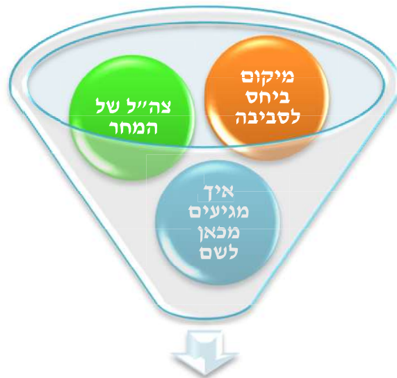
תהליך עיצוב אסטרטגיה

חשיבה) לגבי סוגיות מורכבות. מאחר שצה"ל מאופיין כבעל אוריינטציה טקטית, יש לטפח אינטואיציה אסטרטגית. אג"ת חייב לשמש כ"סוכן השינוי" הארגוני בנושא.