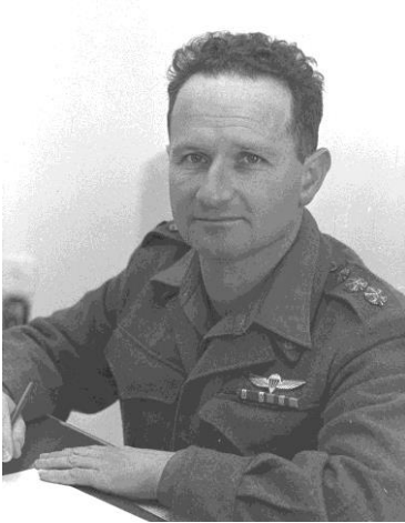
אלוף פיקוד מרכז עוזי נרקיס, "משחרר ירושלים", 1959

"אלוף הניצחון" ממלחמת סיני, האלוף שמחוני ואת "משחרר ירושלים", האלוף נרקיס ופחות לטובה את מפקד פיקוד הדרום במלחמת יום הכיפורים האלוף גורודיש ואחרים.