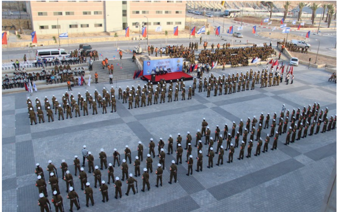
תמונה 2: חנוכת בה"ד 13 בעיר הבה"דים בנגב