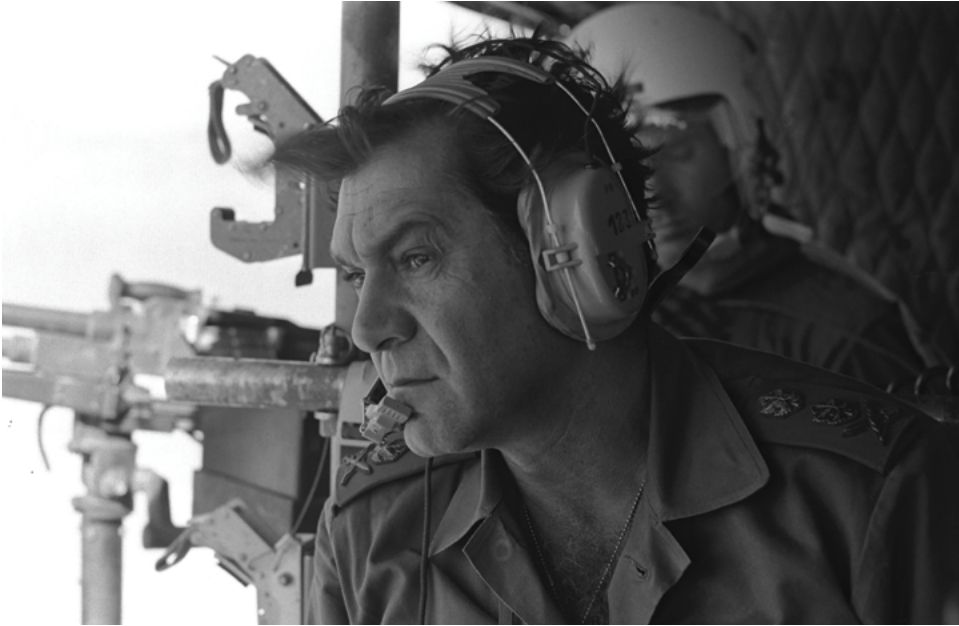
הרמטכ"ל דוד אלעזר במסוק בדרכו לגזרה הדרומית. תכונותיו האישיות של דוד השפיעו רבות על ניהול המערכה.

בעקבות קרב סן סימון, אחד הקרבות הקשים ביותר במלחמה. בשלב מסוים בקרב נדמה היה שלא נותרה ברירה אלא אחת - לאפשר למי שמסוגל לכך לסגת, והמפקדים יפוצצו על עצמם ועל הפצועים שיישארו את כותלי הבניין בו היו נצורים. רק ברגע האחרון, כאשר נדמה היה שכלו כל הקיצין, החלה נסיגת הכוחות הערביים שגם הם הותשו והקרב הסתיים בניצחון. אורי בן ארי, ראש המטה של פיקוד הדרום במלחמת יום הכיפורים, היה אחד המפקדים הבולטים בקרב, ולהערכתו "היה זה אחד הקרבות שעיצבו את דמותו [של אלעזר] ואיפשרו לו להתפתח כפי שהתפתח". 15 אלעזר עצמו תימצת 20 שנה אחר כך את המורשת שהותיר בו הקרב: "כאשר אתה נתון בקרב קשה ואכזרי, עליך לזכור תמיד שגם האויב במצב קשה כמוך. אם לא תוותר אתה, יוותר האויב. מי שיחזיק מעמד ברגע הקשה, הוא יזכה". 16 הלכה הזו עמד בירכתי תודעתו במצבים קשים במיוחד בתחילת מלחמת יום הכיפורים ותרם לנחישותו שלא לוותר.