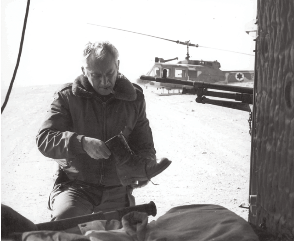
הרמטכ"ל לשעבר, רא"ל (במיל") חיים בר-לב, בסיני. מינויו של בר-לב כמפקד חזית הדרום תרם לניהול תקין של פיקוד הדרום.