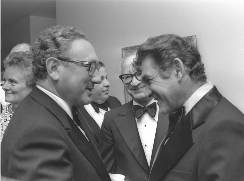
מזכיר המדינה הנרי קיסינג'ר (משמאל) משוחח עם דוד אלעזר לפני ארוחת הערב בבית שגריר ישראל בווינגטון, (צלם: משה מילנר; לשכת העיתונות הממשלתית).

אלא גם עם לחץ כבד שהפעיל רחבעם זאבי, מלווהו של דיין לאום חשיבה. עמדתו של אלעזר, שניזונה מאינטואיציה טובה ומהניסיון שצבר על בשרו במלחמות ישראל, הזכירה את אותה יכולת בלתי מוגדרת של מצביאים - לקבל את ההחלטה הנכונה ולהתעקש עליה בנסיבות שבהן ערפל המלחמה כבד במיוחד. 68