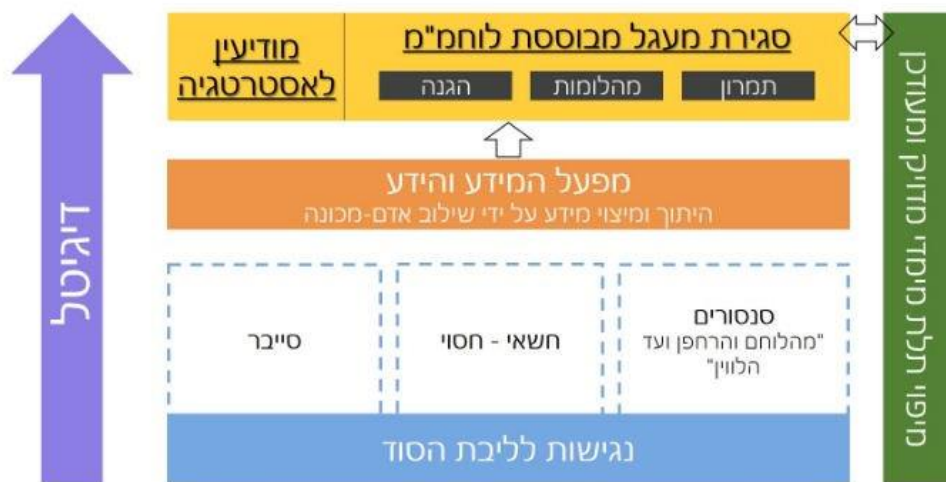
איור 2: יכולות ליבה בתפיסת העליונות המודיעינית