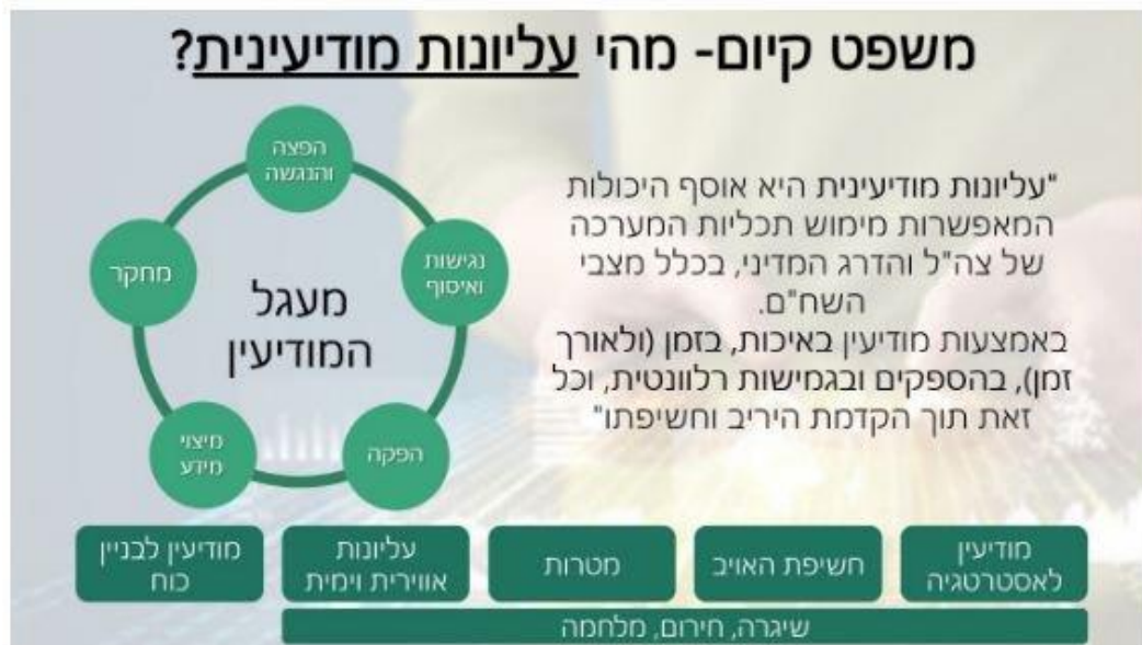
איור 1: עליונות מודיעינית – הגדרה מחדשת

כדי לסייג ולדייק את התיאור השאפתני לעיל של ההישגים הנדרשים חשוב להדגיש כי ההסתכלות על עליונות מודיעינית כעל רף בינארי (או שיש או שאין) היא מטעה . בפועל בשל מגבלות משאבים, אך גם בשל הקשרים שונים וזירות פעולה שונות, קיימות רמות של עליונות מודיעינית . בפרט קיים הבדל בין רף הישג מוחלט ("עליונות מודיעינית ניצחת" שהיא קשה עד מאוד להשגה), שבו יש לנו יכולת פעולה ואפקטיביות מודיעינית מלאה, בלי שלצד השני יש יכולת מודיעין משמעותית כלפי ישראל, צה"ל ואמ"ן, לבין רף הישג יחסי ("עליונות מודיעינית"), שבו יש לישראל יתרון מודיעיני על הצד השני במרחב ובזמן נתונים מבלי שהאויב יכול לסכל את מאמצי המודיעין של ישראל.