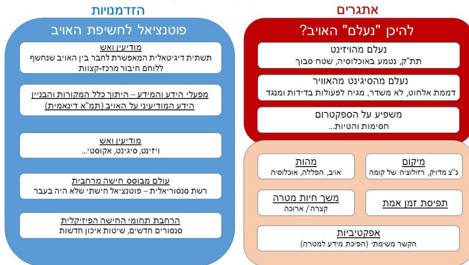
איור 5: מרחב הבעיה והפתרון