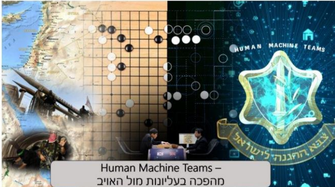
איור 4: המהפכה הדיגיטלית

שהארגון כולו צפוי לעבור טרנספורמציה מתמשכת שמטרתה לשמר את העליונות במצבים משתנים ולהקדים את האויב בפעילות המבצעית. זהו תנאי יסודי לכל המאמצים הרב-ממדיים המובילים כיום בצה"ל.