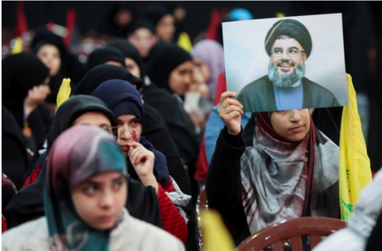
תהלוכת תמיכה בחיזבאללה בדאחיה, פברואר 2024