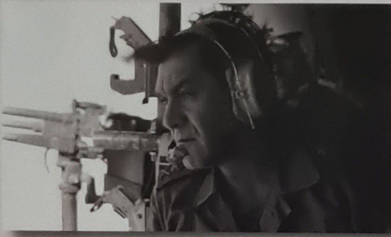
הרמטכ"ל במלחמת יום הכיפורים, רא"ל דוד אלעזר ("דדו")