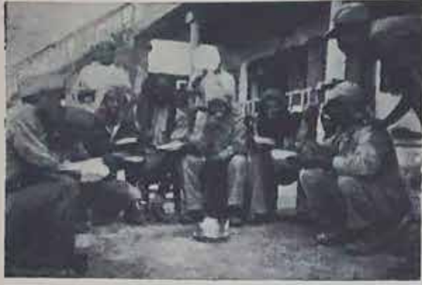
اسرى مصريين يتناولون الطعام

ايها الضباط ! ايها الجنود ! انكم مزلين عن العالم الخارجي انكم تجهلون ما هو مصيركم في هذا الحصار . فكل يوم يأكدون لكم بأن النجدة ستصلكم وتفرقكم من هذا المأزق الحرج . لكن الوقت قد حان لان تفهموا ايها المحاربون ان ليس بإمكان احد ان يفك حصاركم هذا ، فلا جدوى لانتظاركم .