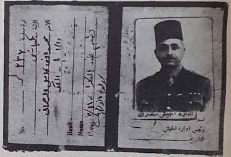
قائد الكتيبة التاسعة التي ابدت عن بكرة ابيها

استمعوا الى صوت الاسرى المصريين في الساعة السابعة من كل مساء على موجة . ( 5.7 MGC او ٥٢٦٦ ) طلعوا جريدة «الي ابن المفر» لسان حال الاسرى المصريين .