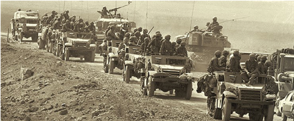
שיירת אוגדה 146 (באדיבות ארכיון צה"ל ומערכת הביטחון).

לסיכום נוהל הקרב ראוי לציין את הסדר והשיטה שבה נשמרו בקפדנות שלבי המְחשב והעיבוד של עבודת המטה באוגדה (נוהל הקרב והפקודה). מפקד האוגדה התחיל את נוהל הקרב בו־זמנית עם תנועת כוחות האוגדה מהמרכז לצפון והכניס שתי חטיבות (4 ו־9) שלחמו כבר יממה, ושילבן בתוכנית התקפת־הנגד. במהלך המפגש בפיקוד הצפון והסיוור בדרום הרמה הוא גיבש לעצמו את תוכנית ההתקפה האוגדתית, ובאותו ערב הוא אישר את תוכניתו בפיקוד. שעתיים לאחר אישור התוכנית קיים קבוצת פקודות (קפ"ק) מסודרת (וזאת בלא לזמן לאחור את מח"ט 4 ואת מח"ט 9, שנמצאו באותה עת בלחימה). מפקד האוגדה יצר איתם קשר אלוטטי, אך לא הסתפק בכך ושלח את נציגיו כדי להסביר להם פנים אל פנים את תוכנית ההתקפה האוגדתית ואת חלקם בה. המפקדה העיקרית מוקמה ברכס פורייה, מה שאיפשר קשר יעיל וללא ניתוקים בין המפקד (גם כשהיה בחפ"ק) לבין הרמה הממונה בפיקוד. פלד עצמו פיקד על התקפת הנגד מלפנים מהחפ"ק, ולסגנון פיקוד זה הייתה חשיבות רבה ביותר.