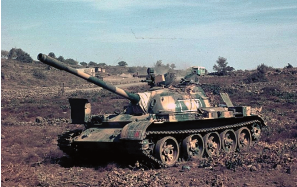
טנקי טי-55 סוריים פגועים לאחר קרב השריון (באדיבות ארכיון צה"ל ומערכת הביטחון).

מצפון להם נערכו חטיבת החי"ר 33 (מדיוויזיה 9) עם שרידי גדוד הטנקים שלה וחטיבת השריון 91 (טי-62) ושרידי חטיבת שריון 43, אל מול חטיבת השריון 679 מאוגדה 36 שביססה את אחיזתה מדרום וממזרח לנפח בקו סינדיאנה-דהלמייה. ואילו ממערב עדיין לחמו שרידי חטיבות השריון 12 ו-51 עם כוחות חטיבה 179/210 על ציר חושנייה-קצביה. 53