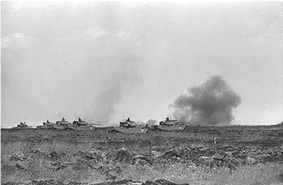
טנקי אוגדה 146 במהלך הקרבות.