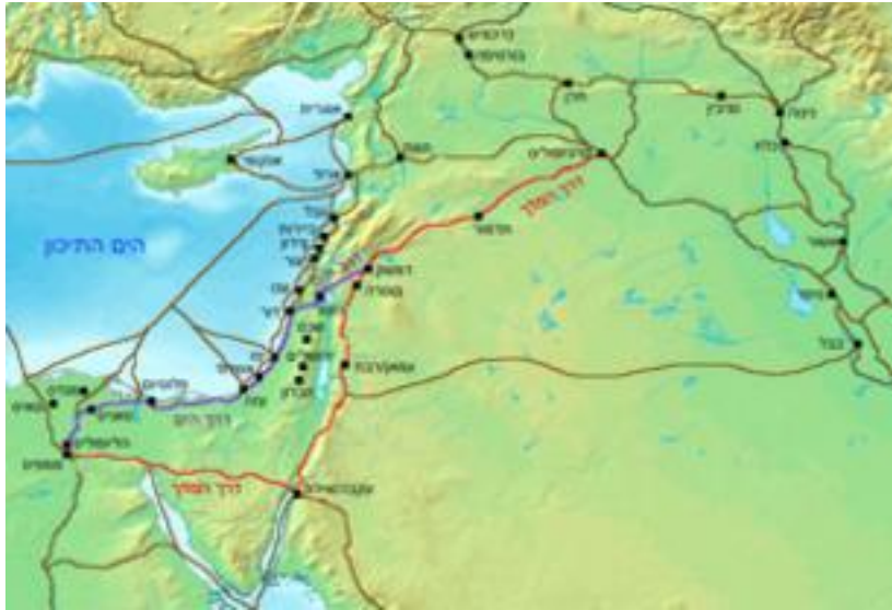
דרך הים (סגול), דרך המלך (אדום), ודרכי מסחר עתיקות נוספות. 1300 לפנה"ס לערך, (מקור: ויקיפדיה).

השינויים הטקטוניים בזירה החברתית כלכלית, הביטחונית והעולמית יחייבו את ישראל לשנות מרכיבים בתפיסת הביטחון הלאומי שלה ואת האסטרטגיה הביטחונית והמדינית בהתאמה. כמו מדינות רבות בעולם המערבי, ישראל צפויה לנטוש את אסטרטגיית ההכלה כהיגיון המוביל ולאמץ גישה פרו-אקטיבית, תחרותית, במסגרתה היא פועלת לעצב את הכלכלה, החברה והביטחון, תוך השתתפות אקטיבית בעיצוב מרחבי של הסביבה המזרח תיכונית.