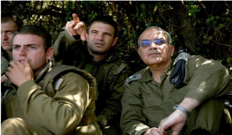
רמטכ"ל מלחמת לבנון השנייה, רב-אלוף דן חלוץ, עם מפקד אוגדה 91, תת-אלוף גל הירש, 2006

תכליתה של התפיסה הייתה להעמיד במקום את תחום הידע האופרטיבי-אסטרטגי ואת יחסי הגומלין בינו לבין הדרג הטקטי שתחתיו ובין הדרג האסטרטגי שמעליו.