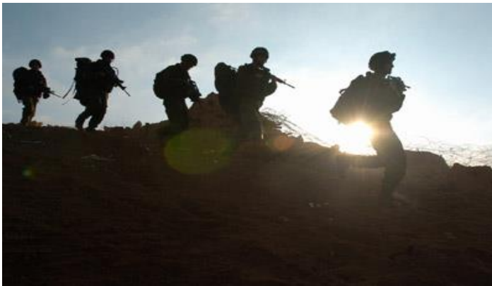
חיילי חטיבת הצנחנים במלחמת לבנון השנייה, 2006

באפריל 2006 פורסמה "תפיסת ההפעלה המטכ"לית של צה"ל", וב-12 ביולי 2006 פרצה מלחמת לבנון השנייה. התפיסה עמדה מיד במבחן המציאות הקשה ביותר – המלחמה.