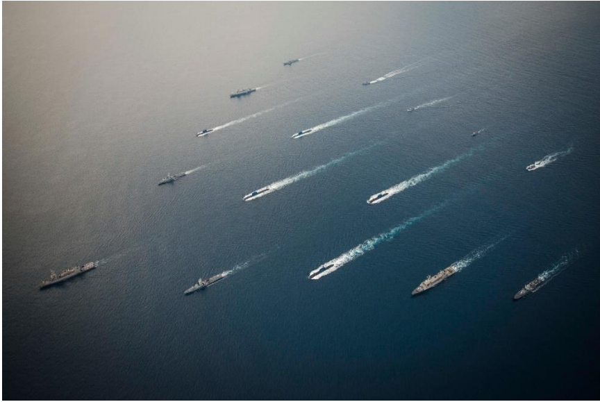
תמרון ימי של ספינות חיל הים 22

השונות, הן לאש האינטגרלית הימית והן לאש מהאוויר. סיוע אש אווירית ימשיך לתמוך את צורכי המשימה על פי יתרונה היחסי – בראש ובראשונה למשימת העליונות הימית – אך גם למשימות נוספות כגון אש להשתתפות וסיוע, הפעלת תוכניות אש לתמיכה במבצעים בזיקה יבשתית או למבצעים מיוחדים הנתונים תחת פיקוד חיל הים ועוד.