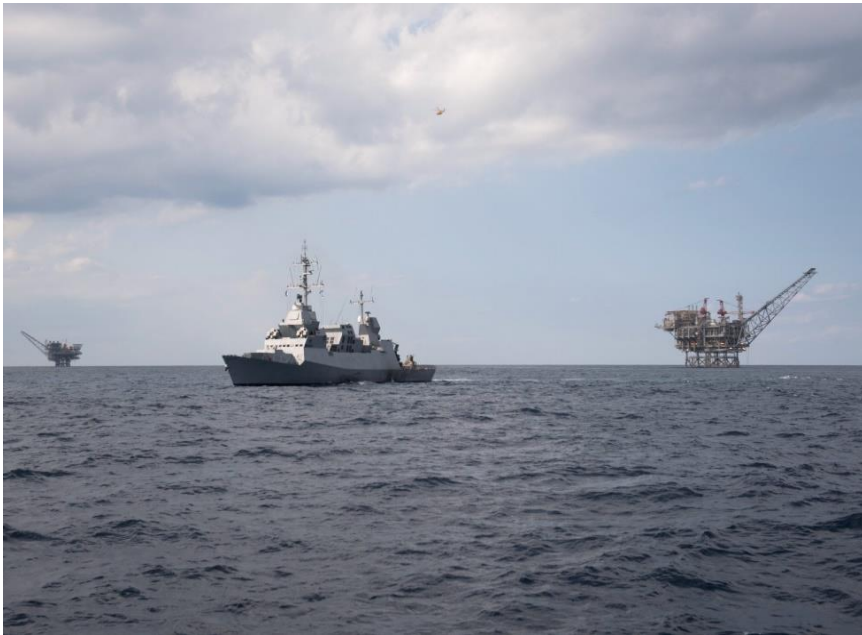
סער 5 מגינה על אסדות הפקת הגז 12

מפני כלל האיומים העשויים לפגוע במערך הפקת הגז הטבעי של מדינת ישראל. להחלטה זו הייתה משמעות רבה – הרבה מעבר להשפעה כזו או אחרת על גודל הצי. עיקר השוני מתבטא בהיבט האסטרטגי של הזרוע כמגינת העצמאות האנרגטית של מדינת ישראל. התמורות שחלו במשק האנרגיה של מדינת ישראל, והעובדה כי הוא מתבסס כבר היום באופן אבסולוטי 10 על גז טבעי המופק מהים, הופך אותו לפגיע מאוד ונעדר חליפיות אנרגטית שאפיינה אותו בעבר. בשל ההישענות המשמעותית על הגז הטבעי מהים להפקת האנרגיה, פגיעה באסדת גז יכולה לגרום לנזק אסטרטגי משמעותי למדינת ישראל. 11 עובדה זו הביאה לכך שעל זרוע הים הוטלו תחומי אחריות חדשים ומשמעותיים לאין שיעור מאלה שהיו לה בעבר, אשר ניתן לומר כי אחריותה עליהם היא למעשה בלעדית.