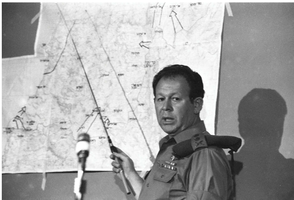
הרמטכ"ל גור במסיבת עיתונאים ב-15 במרץ.

נדגיש כי המאמר בוחן את הדברים רק עד הצומת של אביב 1978, אולם איננו בוחן את השינויים שנעשו בבניין הכוח בעקבות הפקת הלקחים. גם עניין זה מחייב השלמת מחקר.