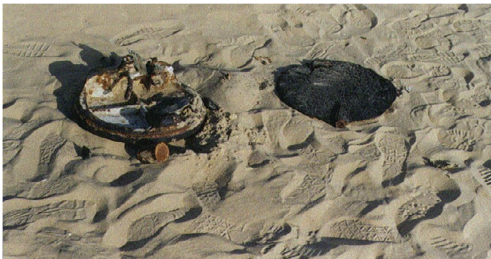
מדף של הטנק שנתגלה בחפירה (צלם: ד"ר חיים רובינשטיין; באדיבות הצלם).

לרפואה משפטית הובאו השניים בדצמבר 1999 לקבורה בישראל, 26 שנים לאחר המלחמה. 189