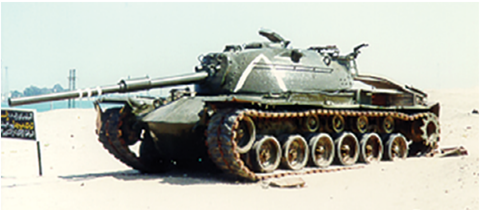
טנק מג"ח M48 באנדרטה מצרית מול איסמעליה, צבוע מחדש.

במלחמה הזאת לא היו תנאים כאלה. שום מפקד יחידה לא יכול היה להיעצר ולמנות קצין חוקר לכל נעדר. המלחמה הייתה ממושכת, והתנאים שבהם הורגלנו כיתנאים רגילים - לא היו [...]. מכאן קם הצורך במנגנון מרכזי שיטפל בבעיה, לאו דווקא מהצינור של היחידה, אלא הרבה יותר חשוב [...]. מלמעלה, דבר שאין לו כיסוי עד היום [20 בנובמבר 1973] בפקודות. 26