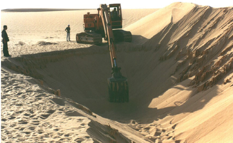
תחילת החפירות לאיתור שריד הטנק של ניסנהויז.

ב-1998 מונה באית"ן צוות חקירה חדש לאיתור נעדרי מצרים. במהלך החקירה המחודשת נותחו שוב כל תצלומי האוויר שבוצעו בשטח בתקופת המלחמה ולאחריה. במסגרת בחינת התצלומים בהגדלה ניכרת עלה כי בתצלום אוויר יומיים לאחר הפגיעה בטנק נראות שתי תלוליות חול בסמוך לו - תלוליות שלא נצפו בתצלום האוויר יממה קודם לכן. בתצלום האוויר מ-27 באוקטובר כבר לא נמצא זכר לאותן תלוליות, אשר ככל הנראה נקברו תחת ערמת עפר שיצר טרקטור שהקים מחפורות מגן במקום במסגרת היערכותה של הארמייה השלישית שהייתה נצורה באותה העת בידי כוחות צה"ל. 187