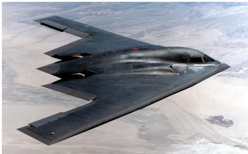
מפציץ B-2 אמריקני בזמן טיסה

במילותיו של אדוארד לוטוואק, בספרו 'אסטרטגיה של מלחמה ושלום': דפוס הפעולה של מערכה באש שהופעלה ארבע פעמים מאז (כולל) מלחמת לבנון השנייה, עבר את "נקודת השיא של ההצלחה". 3 היעילות הטקטית בשיאה – המטוס, החימוש והמודיעין מאז הומצא המטוס – לפני 114 שנה – התפתח במהירות הכוח האווירי והפך להיות מרכיב מרכזי בעוצמתו של כל צבא מודרני. מאז מלחמת העולם הראשונה ממלאים מטוסים מגוון רחב של משימות – החל מסיוע קרוב לכוחות בחזית וכלה בהפצצות אסטרטגיות – ולמעשה לא ניתן כיום לחשוב על השגת הכרעה בעימותים צבאיים ללא כוח אווירי.