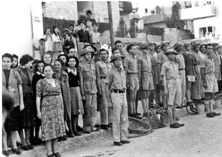
קבוצת צופי אש (ARP) מתנדבים בירושלים בשנת 1942. המלחין יוסף טל עומד ליד האשה בסודר השחור.

"אין הכרח שיימצא קשר כלשהו בין העבודה שיש לעשותה לבין גודל המנגנון המופקד על מילואה" מזכיר לנו כותב המאמר, מתוך דבריו של סא"ל (לימים האלוף) שלמה גזית, משנת 1959, בהסבירו את חוק פרקינסון. אין מחלוקת על עולם הבעיה במלחמה הבאה. האתגר לכוחות ביטחון הפנים לצד האיום על העורף מביא איתו מורכבות רבה לצד הלחימה בחזית ובעומק שטח האויב. כותב המאמר מתייחס למאמרים שפורסמו לאחרונה והציעו מספר פתרונות מדגמים שונים המתייחסים להקמת כוח חדש מסוג משמר לאומי, ומבקש לקרוא תיגר על המהירות בה אנחנו מציעים פתרונות בדמות התארגנויות חדשות, מלהיבות ו"חדשניות", שלא תמיד תורמות לבניין והפעלת הכוח באופן המיטבי לארגון הקיים.