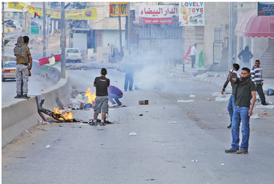
זעם ברחוב הפלסטיני אחרי הפגנה נגד מחסום קלנדיה 5

ושומרון, והיום צה"ל יכול להכנס לשטחי A כמעט בכל לילה לשם מעצר מבוקשים, והכתרים, המחסומים והסגרים הפכו לשיטת פעולה מקובלת גם אחרי שהמבצע הסתיים באופן רשמי.