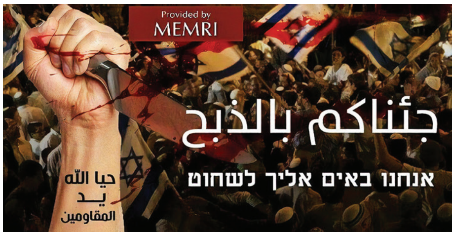
כרזת הסתה ושבח לפיגועי דקירה שהועלתה לרשתות חברתיות (MEMRI)

עם זאת הרושם ומרכיב ההשראה של פיגועי הבודדים דעך, ככל שהם התרבו. הבודדים אכן נתפסים כגיבורים - הם מתפרסמים ברשתות החברתיות ובתקשורת, וכל פיגוע מקבל כותרות גם בצד הישראלי וגם בצד הפלסטיני - אך מצב זה נמשך זמן קצר בלבד עד שמגיע המחבל הבודד הבא.