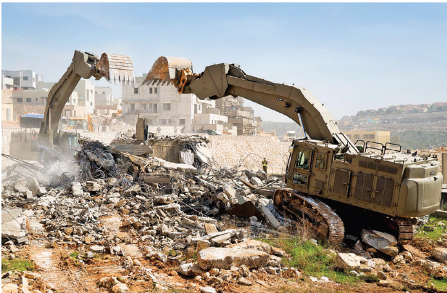
כוחות צה"ל הורסים בית מחבל

ההרתעה במקרה של הבודדים מתכתבת בצורה עמוקה עם הנושא התודעתי-רגשי, ואם מנהלים את העניין בתבונה, ניתן לייצר הרתעה. אחד הכלים להרתעה הוא פעולות השחרה של המפגעים. אם המאפיין העיקרי של תופעת הבודדים הוא מרכיב ההשראה, כלי זה מיועד לנטרל אותה. ערוצי המדיה והרשתות החברתיות מציגים את המפגעים כגיבורים לאומיים, מלאי אתוס ושליחות, והם מלאים עידודים וברכות המתמרצות צעירים נוספים לבצע פיגועים. מטרת פעולות ההשחרה היא להציג מידע הסותר את התדמית ההרואית של המפגעים באמצעות גילוי של מניעים אישיים לפיגוע שאין בהם דבר עם מטרה לאומית, כמו בעיה נפשית של המפגע או מניע מיני. ההשחרה מאזנת את הפרסום הנרחב ומכרסמת בהצדקה לפיגוע.