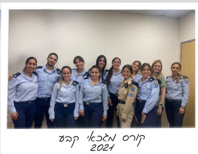
קורס נלכ"א קבע 2021