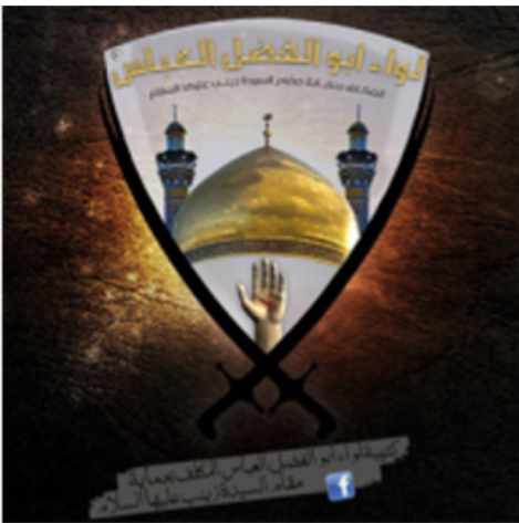
סמל חטיבת אבו אל-פדל אל-עבאס

החטיבה פועלת באזורים שונים בסוריה ונקראת על שם עבאס בן-עלי, אחיו למחצה של חוסיין ומראשוני האסלאם השיעי. החטיבה הוקמה ב-2012 במטרה להגן על המקומות הקדושים לשיעיים בסוריה, בראשם מתחם הקבר הקדוש של סידה זייב (בתו של עלי ונכדתו של הנביא מוחמד) שבדרום דמשק, ובהמשך עברה לפעילות כנגד גורמים סוניים ואמריקניים בסוריה.