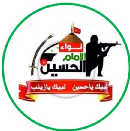
סמל חטיבת האימאם חוסיין

מרבית המגויסים מגיעים מסוריה, עיראק ולבנון, ומיעוטם מתימן, אפגניסטן, ניגריה וסודאן – אלו סה"כ מונים כ-6,000 לוחמים. סדר הכוחות בארגון נחלק לשתי קבוצות: כוח לוחם נייד המפעיל טנדרים, הפועל בשיתוף פעולה הדוק עם צבא סוריה כנגד איום המורדים הסוריים וכנגד דעא"ש; וכוח שני הכולל יחידות מוכשרות ומיומנות בשימוש באמל"ח מתקדם כמו כלי טיס בלתי-מאוישים, טילי קרקע-קרקע ואמצעים שונים. מטה הארגון יושב בסוריה, ומפעיל חוליות גם בלבנון ועיראק.