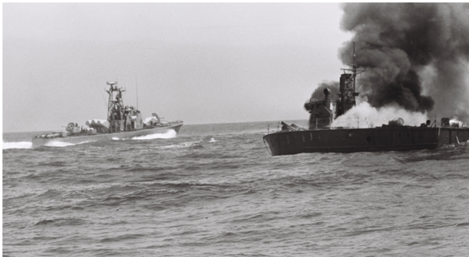
אימון סטי"ל מסוג סער 2 לקראת מלחמת יום הכיפורים.

ניתן לומר שבתחום הימי התהפכו היוצרות. הסובייטים והמצרים הם שנחו על זרי הדפנה אחרי הטבעת "אילת" באוקטובר 1967, ואילו חיל הים הפיק את הלקחים הנכונים ובנה אמצעים ותורת לחימה שאיינו את עדיפות הטווח של הסטיקס (המכונה "חגורת הטילים").