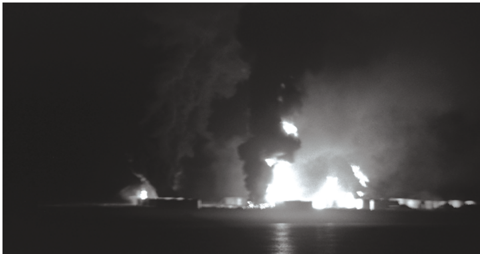
פיצוץ מתקני דלק בלטקיה במסגרת 'מבצע הילה', 11 באוקטובר 1973 (צלם: אלון ריינגר; באדיבות לשכת העיתונות הממשלתית).

הפגזות הנמלים המוצלחות יצרו נרטיב שעל פיו הייתה להן תרומה חשובה למהלך המלחמה, שכן "היא גרמה לו [לסורי] נזקים כבדים וחייבה אותו לרתק כוחות שריון לצורך הגנה על מתקנים חופיים". 26