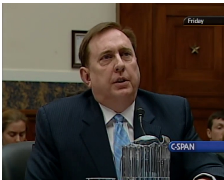
תמונה 2: דגלס מקגרור בקונגרס האמריקאי (צילום מסך מ-10 C-SPAN)

מקגרור גם תומך במערכת תחלופה יחידתית – מערכת שתבטיח שהחיילים שאומנו יחדיו יילחמו יחדיו, ובכך יתאפשר לחיילים מתמרנים להתאמן עם כוחות מזרועות אחרות באותו לוחם זמנים של אימונים, פריסה ושיקום. זאת במקום המערכת הקיימת, מערכת התחלופה האישית (The Individual Replacement System) שמקגרור מאשים כגורם העיקרי לקשיים שנתקל בהם צבא היבשה בלחימה במלחמת המפרץ הראשונה ובחבל הבלקן בשנות התשעים. "מערכת התחלופה האישית" קובעת היכן ולכמה זמן חייל יילחם במלחמה. מפני שהמערכת שולחת חיילים ליחידות בהתאם לצרכי היחידה ולאורך השירות של כל חייל וחייל, יש מעגל מסחרר של כניסות ויציאות מכל יחידה לוחמת במשך פריסתה (שעלולה להיות בצד השני של העולם). לעומתה, "מערכת התחלופה היחידתית" שולחת יחידות שלמות לזירות מלחמה ופורסת יחידות אורגניות בשדה הקרב במקום היחידות המאולתרות של מערכת התחלופה האישית. לא פחות חשוב – מערכת כזאת תספק וודאות לחיילים על שאלות חשובות להם כמו היכן יגורו, מתי הם עשויים להישלח להילחם ומתי יוכלו לנוח בבית עם משפחותיהם. מקגרור רואה בכך השפעה חיובית על המוטיבציה ושביעות רצון החיילים מצבא היבשה כארגון.