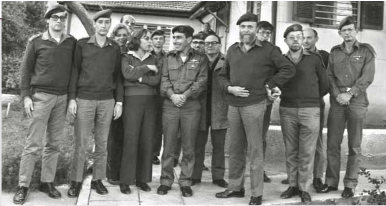
האלוף חיים נדל נכנס לתפקיד נשיא בית הדין הצבאי לערעורים, פברואר 1979; מימין לשמאל: אביגדור רביד, אברהם פריש, בנימין שטרן, יורם צלקובניק, האלוף דני מט, אהרן אלפרן, האלוף חיים נדל, איתן מגן, דליה דורנר, צבי גורפינקל ויורם גלן