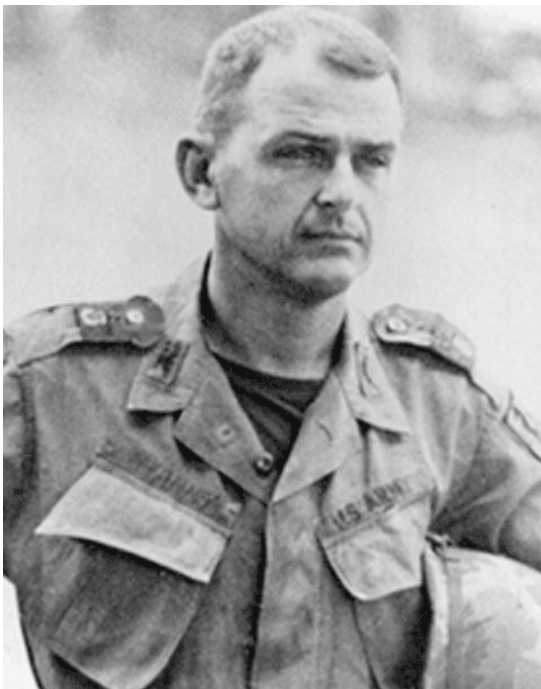
תמונה 1: גנרל דון א. סטארי בצעירותו 1

שלישית, הוא הטיל על סטארי ועל מרכז השיריון בפורט נוקס להוביל את פיתוח תורת הקרב המשולב, כולל לוחמת החרמ"ש, שהייתה עד אז נחלת מרכז החי"ר שבפורט בנינג. דהפיו התעלם מהטענות נגד ההשתלטות של סטארי, שכן לקחי מלחמת יום הכיפורים שכנעו אותו שתפיסות מפקדי החי"ר, שנגזרו מהניסיון העשיר של וייטנאם, אינן רלבנטיות למלחמה