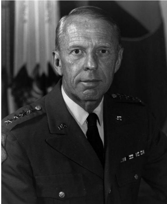
תמונה 1: גנרל וייליאם א. דהפיו.

אחרים טענו נגד "הגנה פעילה" שראשית, הדוקטרינה החדשה שמה הדגש רב מדי על מבצעים הגנתיים ופחות מדי על מבצעים התקפיים; שנית, לכוח האמריקאי אין יכולת להתמודד עם הדרגים השני והשלישי של המתקפה הרוסית, גם אם בתחילת המלחמה הוא יצליח לבלום את הדרג הראשון; ושלישית, כך לפי טענתם, תקנון השדה החדש הוא ספר מתכונים ולא דוקטרינה.