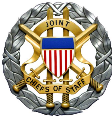
הסמל של מטה הזרועות המשולבים האמריקאי.

המטות המשולבים, כמערכת ארגונית מתאמת, פעלו בצורה יעילה במהלך המלחמה תוך שהם יוצרים אחדות פיקוד ברמה האסטרטגית וריכוז מאמץ בתחומי הייצור המלחמתי, הקצאות כוח אדם ואמצעי לחימה לפי דרישות הזירות, איסוף מודיעין ניתוחו והפצתו, תעמולה ומחקר ופיתוח. 19 בחלק מהמקרים פיקחו סוכנויות אזרחיות על מחלקות אלו תוך תיאום כלל המאמצים להשגת ניצחון מכריע על גרמניה ובוודאי על יפן שבגזרתה הוטל עיקר נטל המלחמה והלחימה על כוחותיה הצבאיים של ארצות הברית.