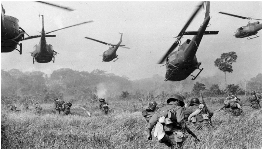
מלחמת וייטנאם, 1967.

כפי שראינו למרות יצירת מוסד המטות המשולבים הרי הבדלנות הזרועית הביאה להתבצרותה של כל זרוע מאחורי הישן והמוכר, קרי התמקדות בהתמחות המבצעית המיוחדת של כל זרוע בשדה הקרב. מגמה זו הוכחה בשתי המלחמות הגדולות שארצות הברית ניהלה לאחר מלחמת העולם השנייה, קוריאה ווייטנאם. למעשה תפיסת המבצעים המשולבים בצבא האמריקני הגיעה לשפל מדרגה לאחר וייטנאם וכל זרוע חזרה ביתר שאת להתמקד בעצמה ובניסיון לשקם אותה ככוח לוחם. במציאות זו אין זה מפתיע שתפיסת המבצעים המשולבים לא זכתה לעדיפות מחשבתית, תורתית ואף מעשית.