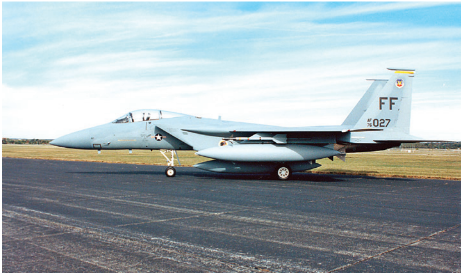
תמונה 3: ה-F-15A נכנס לשירות ב-1974, אחרי תום מלחמת וייטנאם 39

עידן ה-F-15, כמטוס קרב חד-משימתי, היה קצר בהיסטוריה התעופתית האמריקאית. בפועל, האמריקאים הבינו שאין יתרון גדול במטוס ייעודי לקרבות אוויר בלבד והבינו שאין הרבה הבדל בין מטוס לעליונות אווירית ובין מטוס רב-משימתי. לכן, כבר בשנות ה-80 החלה הצטיידות בחיל האוויר במטוסים רב-משימתיים, כך למשל, מטוס ה-F-16. 38 בשירותו בחיל האוויר (האמריקאי והישראלי) הוא הוכיח עצמו גם כמטוס יירוט מעולה. כמו-כן פותחה למטוס F-15 גם גרסה למשימות אוויר-קרקע, ה-F-15E Strike Eagle. כיום, מטוסי הדור הבא - ה-F-22 וה-F-35 - תוכננו כמטוסי קרב רב-משימתיים. אמנם יכולות האוויר-קרקע אצל ה-F-22 הוגדרו כמשניות למשימת העליונות האווירית, אך הפעלתו המבצעית של מטוס זה, החל מספטמבר 2014, הייתה דווקא בתקיפת מטרות קרקע של ארגון המדינה האסלאמית וכן מתן סיוע אווירי קרוב.