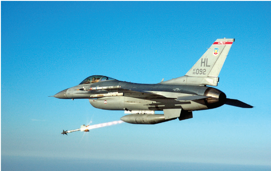
תמונה 4: F-16 אמריקני משגר את ה- AIM-9 Sidewinder 47

מביצועי הטיילים במלחמת וייטנאם. זאת כיוון שבחינת מאפייניו המבצעיים של הפניקס מעלה את העובדה הפשוטה כי הצי המשיך לדבוק באמצעי לחימה אשר יהיו מסוגלים ליירט מפציצים וטיילי שיוט מטווחים הרחוקים מנושאות המטוסים. 46 טילי ה-F-14-Phoenix, נוסף על מערכות הרדאר שהותקנו על המטוס, היוו מערכת קרבית שלמה, שכל מטרתה הייתה התמודדות עם האיום שהציבה הזרוע הימית של הצי הסובייטי.