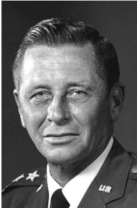
תמונה 5: גנרל רוברט זיקסון, מפקד ה-TAC מ-1973 עד 1978 61

ושל עיראק ומטוס המיראז' שהיה ברשותה של לוב. בהתנגשויות אוויריות הצליחו טייסי חיל האוויר להפיל גם מטוסים אלה, לעיתים קרובות על-ידי מטוסים דומים. כך, למשל, במלחמת יום הכיפורים הצליח טייס ישראלי שהטיס מטוס מיראז' להפיל טייס לובי אשר הטיס גם הוא מיראז'.