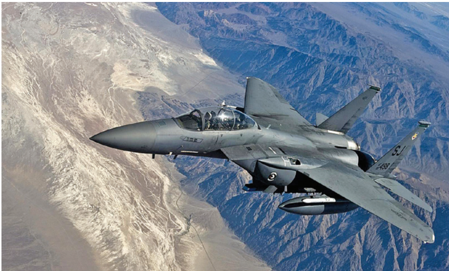
תמונה 6: מטוס ה-F-15E, שהיה מיועד לתקוף יעדים בקרקע בנוסף לייעודו כמטוס מיירט 78

לעשות וכי זוהי פלטפורמת נשק בעלת עליונות קרבית. 76 כאמור, הרוב המכריע של קרבות האוויר בוצע על-ידי מטוסי F-15 שאותם הטיסו טייסים אמריקאים. אף מטוס לא הופל בקרב אווירי, כאשר כל ההפלות נעשו באמצעות טילי ה-Sparrow וה-Sidewinder. 77 שנות הפיתוח הרבות והאימונים האינטנסיביים הביאו גם לעליונות הטייס האמריקאי על פני יריבו העיראקי. לפיכך המלחמה הוכיחה גם את חשיבותו של האימון האינטנסיבי. קודם למלחמה היה חשש רב בארצות-הברית מפני היתרונות המבצעיים של המיג-29 אך הפלתם של חמישה מטוסים כאלה לא הצביעה רק על העליונות הטכנולוגית של ה-F-15 ובעיקר על יכולתו לשגר טילי אוויר מטווחי רחוקים (BVR), אלא גם על ההבדל המהותי בהכשרתו של הטייס. בכך למעשה השלים TAC את תהליך שיקומו שהחל לאחר מלחמת וייטנאם. שינויים ארגוניים בחיל האוויר הביאו לכך שביוני 1992 חדל TAC מלהתקיים כפיקוד עצמאי אך מסורת תהליכי ההכשרה והאימונים נמשכה.