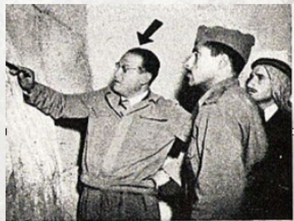
البطل حسن سلامة: قائد الجبهة الجنوبية