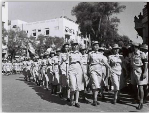
מצעד נשים בצה"ל

עוד לפני קום המדינה, נשים שירתו בשורות כוח המגן היהודי בארץ ישראל, לרבות במחותרות ההגנה, האצ"ל, הלח"י והפלמ"ח, והן מילאו תפקידי פיקוד ולחימה בחזית מלחמת העצמאות. נשים יהודיות גם התנדבו לצבא הבריטי ונטלו חלק במלחמת העולם השנייה.