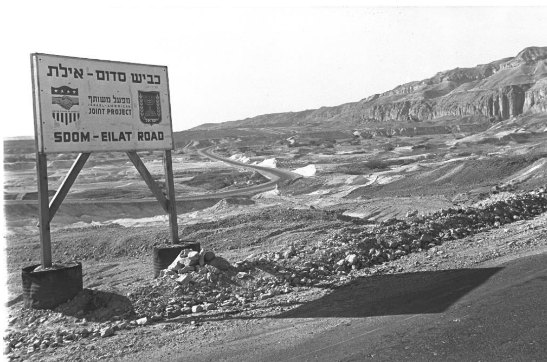
כביש סדום-אילת, נובמבר 1963

מששמעו יתר חברי המשמר את צרורות הירי, הם רצו לכיוון שממנו נשמע הירי, ובחלוף מספר עשרות מטרים בלבד פגשו בטוראי דגש כשהוא פצוע. טוראי דגש נשאל על-ידי מפקד המשמר היכן כלי הנשק שלו, אך הלה לא השיב על כך. חיילי המשמר ערכו סריקות במקום, אך לא עלה בידם לאתר את כלי הנשק. לצד זאת, מהסריקות עלה שהכיוון שממנו הגיעו הירורים - היה הגבול עם ממלכת ירדן.