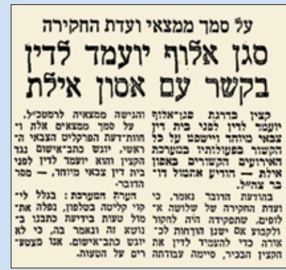
מתוך כתבה בעיתון מעריב, 18 באוגוסט 1971

ע/137/72 סא"ל גד נ' התובע הצבאי הראשי; פסק הדין ניתן ביום 10 באוגוסט 1972; אב"ד: תא"ל אבנון; שופטים: אל"ם דבורין, אל"ם נועם