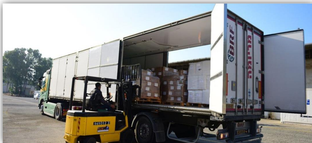
משאית תספוקת הממוענת לרצועת עזה

בפסק הדין קביעות עקרוניות הנוגעות להיקף חובותיה ההומניטאריות של מדינת ישראל כלפי תושבי הרצועה, לאור אירועים אלו. כחלק מפסיקה זו, נתן בג"ץ דעתו, לראשונה, לשאלה הגדולה של מעמד ישראל ברצועת עזה בעקבות יישום תכנית ההתנתקות והיקף החובות החל עליה ביחס לאוכלוסיית הרצועה על רקע זה. הקביעה התקדימית של בית המשפט התוותה את הדרך לאופן בחינת רף החובות של ישראל מול הרצועה והיא ממשיכה להיות רלבנטית גם כיום.